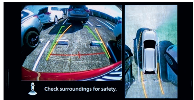
SISTEM DE CAMERE PERIMETRALE (360°)