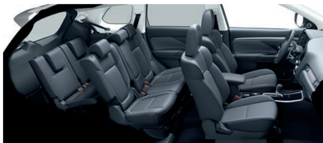
CABINĂ SPAȚIOASĂ 7 LOCURI DOAR LA VERSIUNEA INSTYLE+