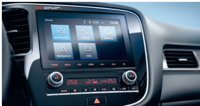
SISTEMUL SMARTPHONE LINK DISPLAY AUDIO (SDA) PERMITE CONECTAREA TELEFONULUI SMARTPHONE LA VEHICUL.