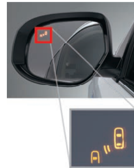
SISTEMUL DE AVERTIZARE UNGHI MORT (BLIND SPOT WARNING)